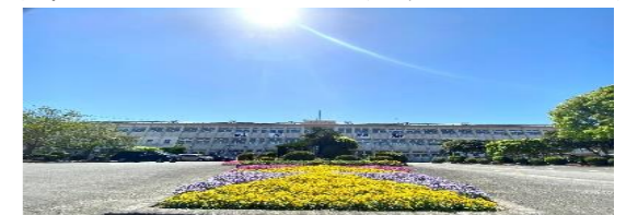
【米ノ津中学校正面】

コミュニティ協議会の皆様には、これからも本校の教育のご理解とご協力を引き続きよろしくお願い致します。