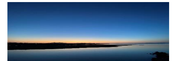
【自宅から望む不知火海】